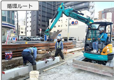
軌道設備を新設中

ペDESTリアンデッキ(歩道橋)や循環ルート区間の整備を行っています。 今後も交通規制や騒音等でご迷惑をお掛けしますが、ご協力の程よろしくお願ひいたします。