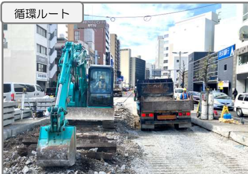
既設軌道設備を撤去中