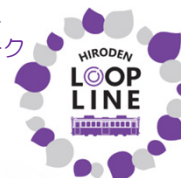
循環ルート ロゴマーク

『紫』を基本色に、“花びら”をモチーフに『まちに、輪を描く』を体現するよう21枚の花びら(21電停)で1つの輪を描いています。