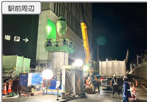
Bペデ PCウェル杭 施工中