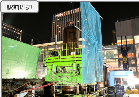
Bペデ 地下支障物撤去 施工中