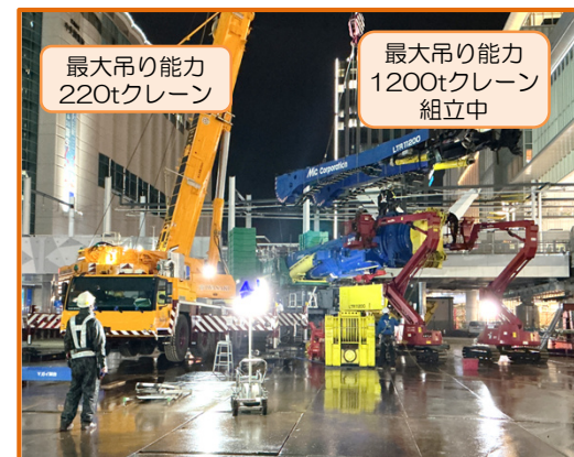
最大吊り能力 220tクレーン

3月下旬より広島駅部の大屋根架設準備作業を開始しています。現在は東ヤードで大型クレーンを使用し、組立作業を行っています。5月下旬にクレーンの巡回試験、6月上旬に1期部分(中央部)の本架設を予定しており、大屋根は今後3回に分け架設します。(2期架設:2027年秋頃予定、3期架設:2028年春頃予定)