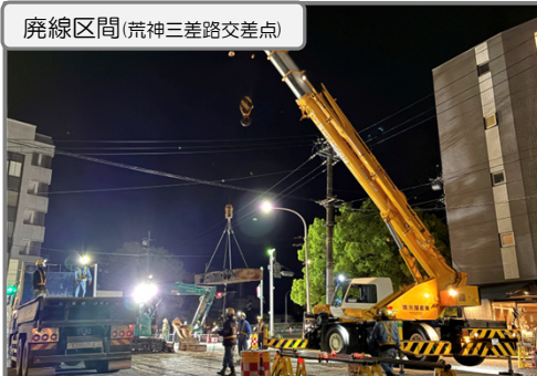
旧軌道部分撤去 施工中

ペDESTリアンデッキ(歩道橋)や循環ルート区間の整備を行っています。 今後も交通規制や騒音等でご迷惑をお掛けしますが、ご協力の程よろしくお願いたします。