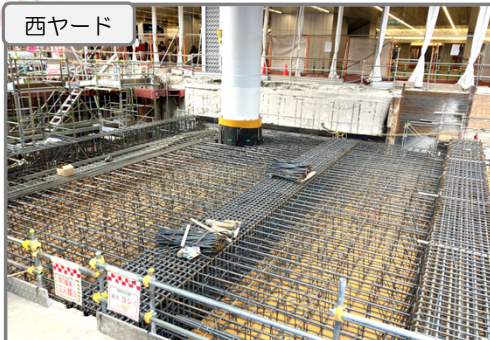
地下拡張部の上床版(天井) 施工中