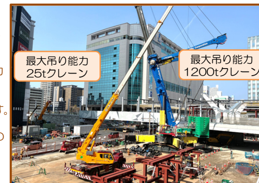
最大吊り能力 25tクレーン