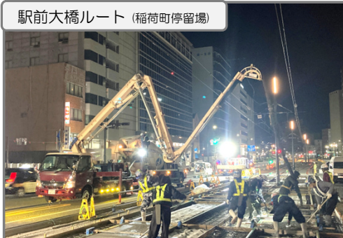
軌道部のコンクリート舗装 施工中