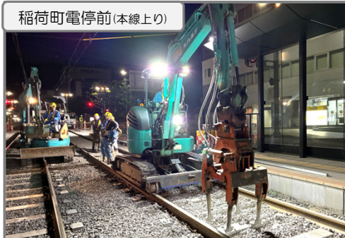
稲荷町電停前(本線上り)