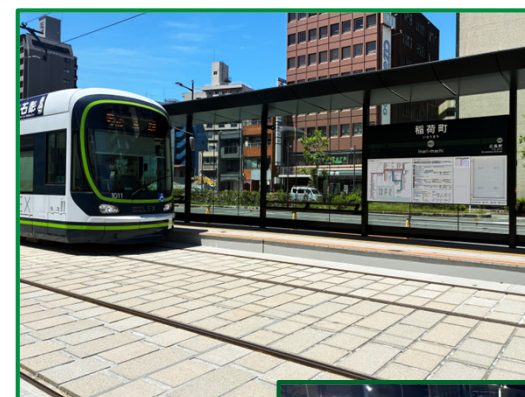
← 稲荷町(皆実線)電停 ブロック舗装 (電停前軌道部)

駅前大橋ルートの軌道部コンクリート舗装を順次施工開始しています。稲荷町電停前では、他とはデザインを変えブロック(ILB)舗装を採用しています。 今回使用しているILB(インターロッキングブロック)は、広島駅南口駅前広場に使用した製品と同じものを使用しています。