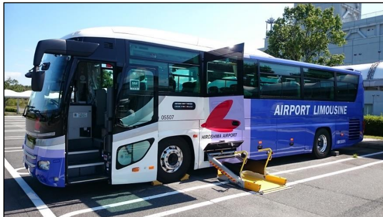
▼車いす対応リフト付きバス車両 外観