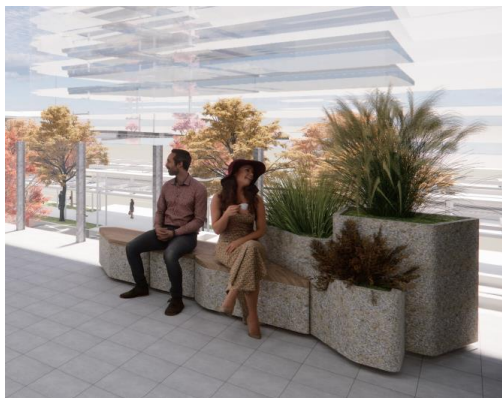
（植栽・ベンチの設置イメージ）