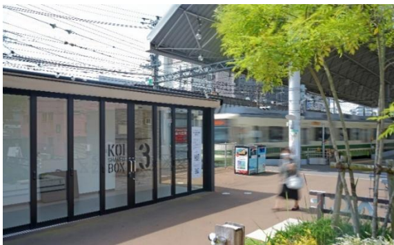
KOI SHARED BOX3 外観

KOI PLACE 「KOI SHARED BOX3」 （所在地：広島県広島市西区己斐本町 1 丁目 18-3）